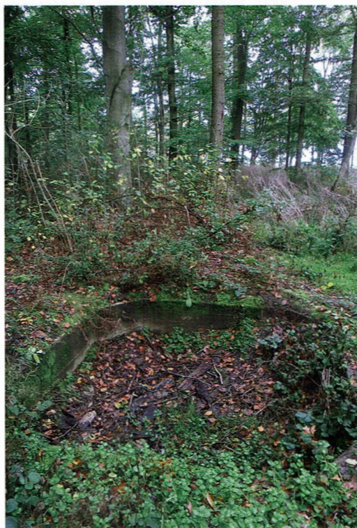
Het fundament van de gesloopte luchtwachtoren in het Enserbos

De luchtwachters meldden hun waarnemingen per telefoon aan het luchtwachtcentrum in Leeuwarden. Het centrum stond in verbinding met Sector Operations Centre van het Commando Luchtverdediging. Daar werd beslist over inzetten van gevechtsvliegtuigen en luchtdoelartillerie en waarschuwen van de Bescherming Bevolking (BB). Gelukkig kwam het nooit zo ver.