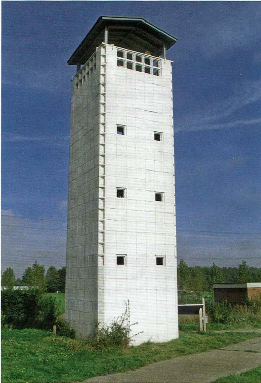
Uitzichttoren Ramspol na de opknapbeurt