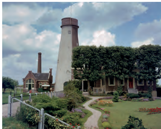
De bakstenen opbouw van de luchtwachtpost op de Molen van Oskam in Haastrecht was op deze foto van 8 juni 1960 nog in gebruik. nr. 406.760.

Van de 276 posten in het land waren er achttien op molenrompen ingericht. De rest bestond uit posten op andere typen gebouwen zoals fabrieken en uit betonnen torens. Molens zonder wieken waren in de jaren vijftig ruim voorhanden. Door overschakeling van windkracht naar andere energiebronnen (zoals dieselmotoren en elektrische motoren) waren wieken niet langer strikt noodzakelijk. Bovendien werden door storm, brand of oorlogshandelingen beschadigde molens niet altijd in oude staat hersteld. De wiekloze molens waren door hun hoogte en hun vrije ligging en uitzicht precies wat het KLD zocht. Met een kleine verbouwing was een molenromp geschikt te maken als luchtwachtpost. Nodig was een open observatieplatform van circa 3 bij 3 meter met een 1,5 meter hoge borstwering en als er ruimte was, een schuilnis of schuilplek.