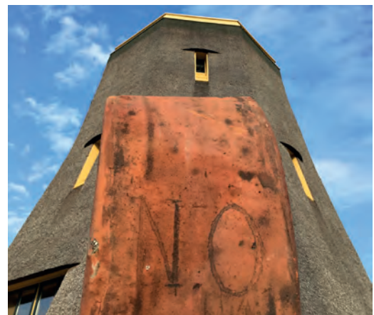
Rietvorst met windrichting NO (noordoost.) afkomstig van de luchtwachtpost op molen No. 6 in Moerkapelle.