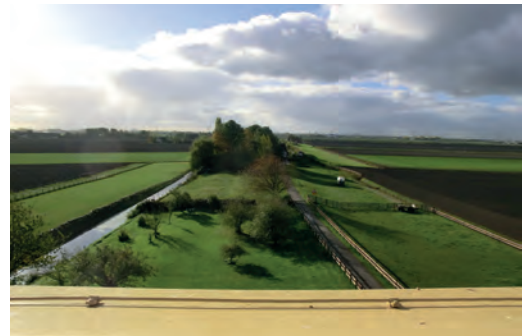
Het vrije uitzicht vanaf het uitkijkplatform op Molen No. 6 in Moerkapelle. Foto S. van Lochem 2016.

aan op eigen kosten de molen te herstellen, in te richten en onderhouden. Aldus gebeurde en de verbouwingkosten waren fors, 20.000 gulden!