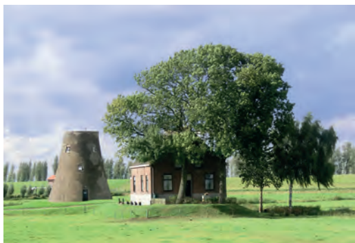
Molen Schuddebeurs in Lage Zwaluwe. Ook hier keken luchtwachters uit naar vliegtuigen. Foto S. van Lochem 2012

Molens die hun wieken verloren hadden trokken in de jaren vijftig van de 20e eeuw de aandacht in militaire kringen. Ze bleken zeer geschikt als uitkijkpost om vliegtuigen te spotten. Het Korps Luchtwachtdienst richtte daarom tijdens de Koude Oorlog molenrompen in als luchtwachtpost, om uit te kijken naar Russische vliegtuigen. Aan zeven molenrompen is deze militaire geschiedenis nog afleesbaar.