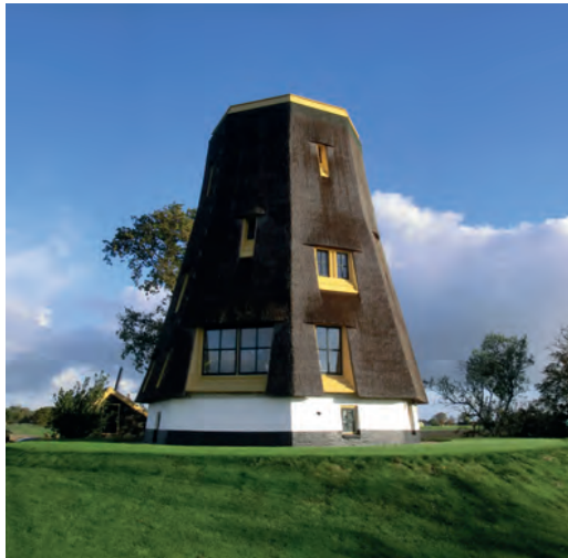
De rietgedekte molen No. 6 in Moerkapelle. De (te) grote afstand van de bovenste raampjes tot de bovenkant verraad de luchtwachtpost die erachter schuil gaat. Foto S. van Lochem 2016.

werk met granaatgaten, verrotte balken en de tussenvloeren en trappen ontbraken, aldus een inspectie van de Genie in 1951. Na herstel en het aanbrengen van een waterdichte vloer nam het KLD de molen in gebruik als luchtwachtpost. Het heeft de levensduur van de molenromp maar kort kunnen rekken. In 1966, twee jaar nadat het KLD er gestopt was met spotten van vliegtuigen, is de molenromp gesloopt.