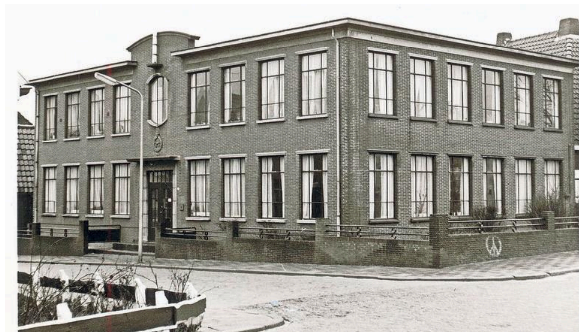
Het commandocentrum aan de Boezemsingel 2 in Alkmaar.

De historisch stadsgeograaf onderzoekt met een team de geschiedenis van de Koude Oorlog in Alkmaar. Ze begonnen afgelopen jaar met een inventarisatie met een oproep en een Koude Oorlog-avond in. Noorlander bereikte naar eigen schatting zo'n 10.000 mensen.