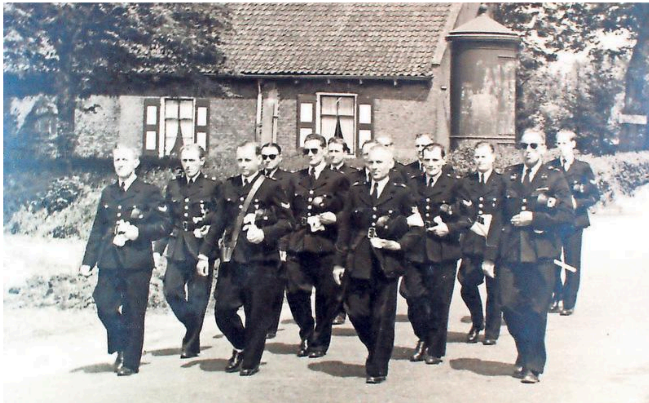
Bescherming Bevolking marcheert door Alkmaar.

De reacties gingen door een zee, met vijftien diepte-interviews als resultaat. „Het is de laatste kans. Er zijn nog maar weinig getuigen uit die tijd met verhalen. De verhalenvertellers zijn zeventig, tachtig of negentig jaar oud. Al die verhalen zijn er nu nog, maar zijn straks voor altijd verloren. De burgemeesters uit die tijd leven bijvoorbeeld ook niet meer.”