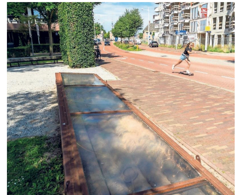
Balken in de bak langs de Korte Vondelstraat...