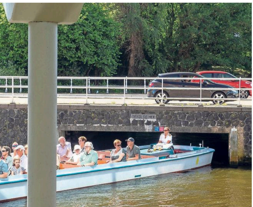
Sluisdeuren onder de Texelsehek en de Bokkebrug als maatregel.