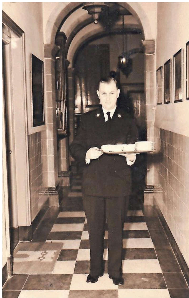
De conciërge bij het stadhuis van 1953 tot zijn pensioen in 1980. Hij verhuisde met zijn gezin naar de dienstwoning bij het stadhuis. Hij had de sleutel naar de bunker.