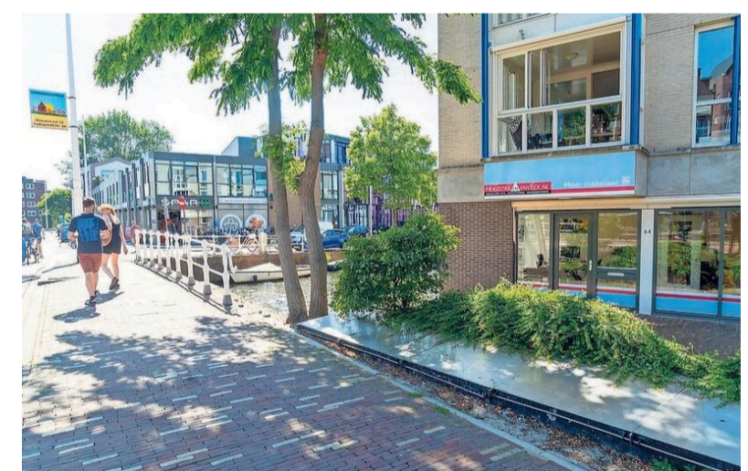
De Koude Oorlogsmaatregelen liggen verstopt in het zicht.