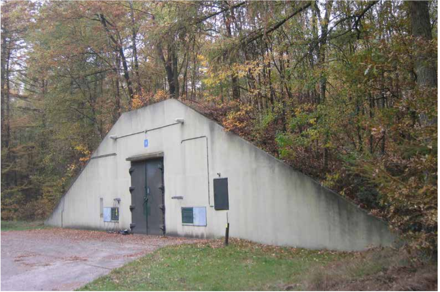
GRONDGEDEKTE MUNITIE-BUNKER S8.

Verscholen in dicht bos en achter hoge hekken staan acht grote met grond afgedekte bunkers en twaalf bovengrondse loodsen voor de opslag van munitie. Ze vormen de kern van het voormalige munitiedepot Nieuw Balinge.