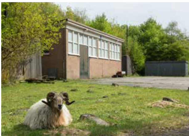
ONDERHOUDGEBOUW (FOTO ANDRIES DE LA LANDE CREMER).

“De kogels van zo’n 90 kilo werden met een glijgoot van een meter of zes uit een tientonner gehaald. In een deken, want de kogels mochten niet beschadigd