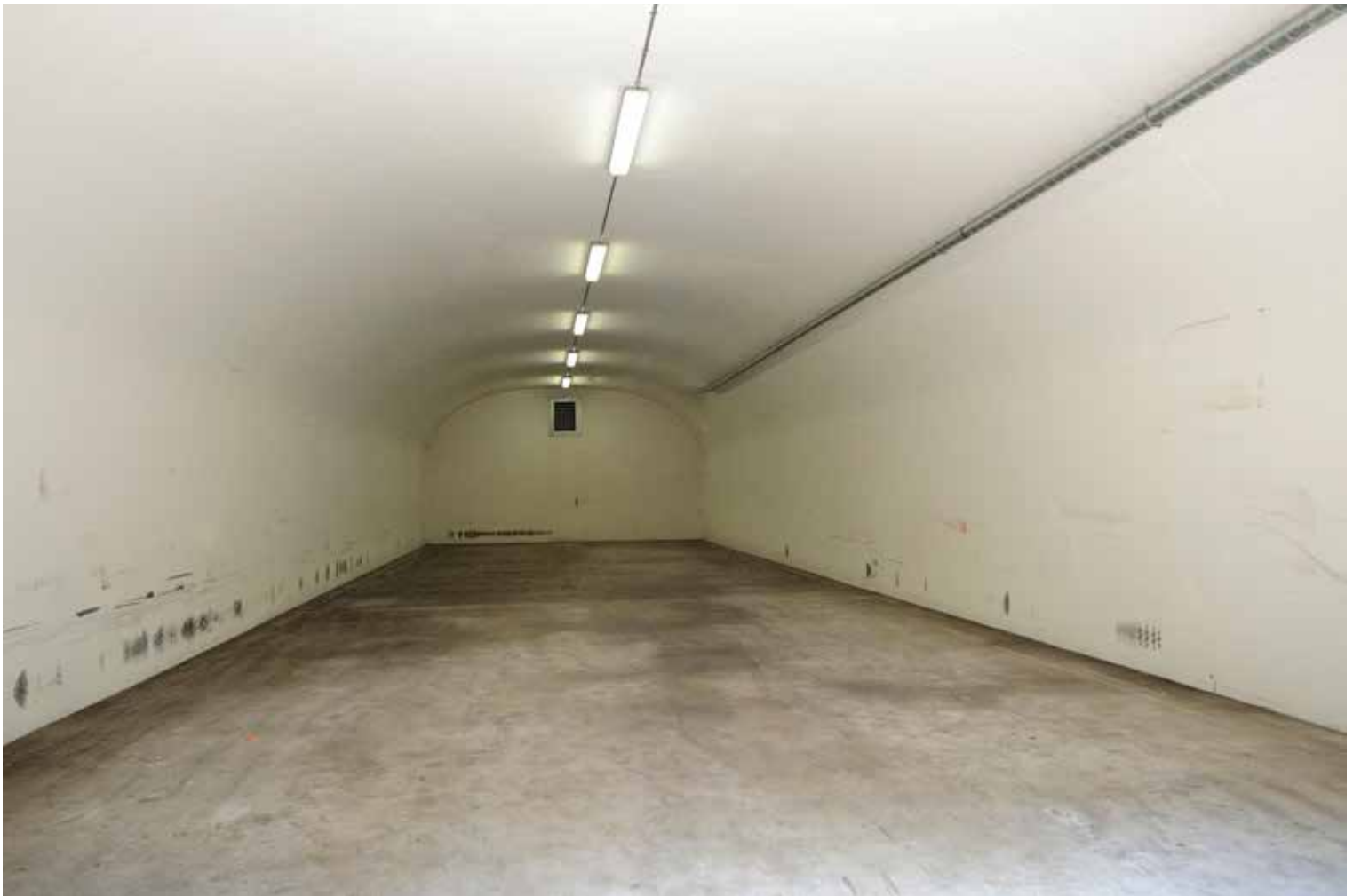
IN EEN GRONDGEDEKTE MUNITIEBUNKER PASTE 100.000 KILO MUNITIE.

een vorkheftruck hadden de medewerkers nog niet. Zware granaten moesten met vereende krachten in en uit vrachtwagens worden geladen.