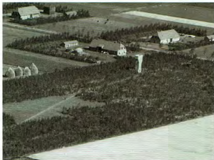
Uitsnede luchtfoto Ens 1954 met de luchtwachtoren in het Enserbos

dat immers een belemmering vormt voor het vrije uitzicht op het luchtruim dat luchtwachters nodig hadden. De Ramspol toren is gebouwd van dezelfde betonnen raatelementen als luchtwachtorens en dat heeft lang voor de verwarring gezorgd. Inmiddels is de 'echte' luchtwachtoren Ens opgespoord, het fundament ervan blijkt nog in het Enserbos te liggen. En de uitkijktoren Ramspol blijkt een recreatieve uitzichtoren te zijn.