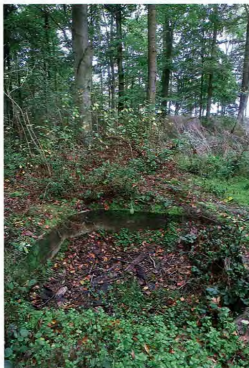
Het fundament van de gesloopte luchtwachtoren in het Enserbos

De luchtwachters meldten hun waarnemingen per telefoon aan het luchtwachtcentrum in Leeuwarden. Het centrum stond in verbinding met Sector Operations Centre van het Commando Luchtverdediging. Daar werd beslist over inzetten van gevechtsvliegtuigen en luchtdoelartillerie en waarschuwen van de Bescherming Bevolking (BB). Gelukkig kwam het nooit zo ver.