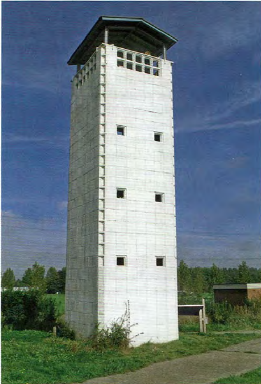
Uitzichttoren Ramspol na de opknapbeurt