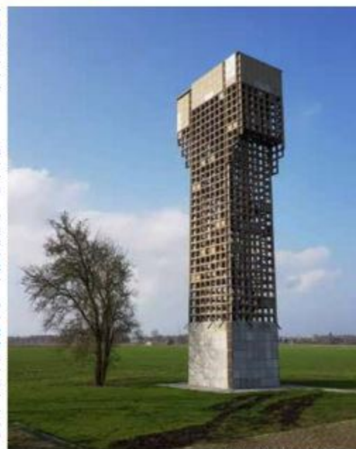
Vliegtuigspotten tijdens de Koude Oorlog: het Korps Luchtwachtdienst 1950-1968

beelden zijn de Luchtwachtdienst in België, het Luftmolekorkorps in Denemarken en de Opviskultbevakning/Strif 50 in Zweden.